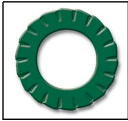
Countersunk serrated lock washer with external teeth